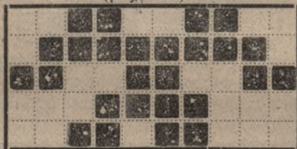
Iepriekšējā zīmējuma pajumte uz divām diagonālēm.