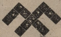
Vēl tā pati pajumte no kvadrātiņiem uz stāņa.